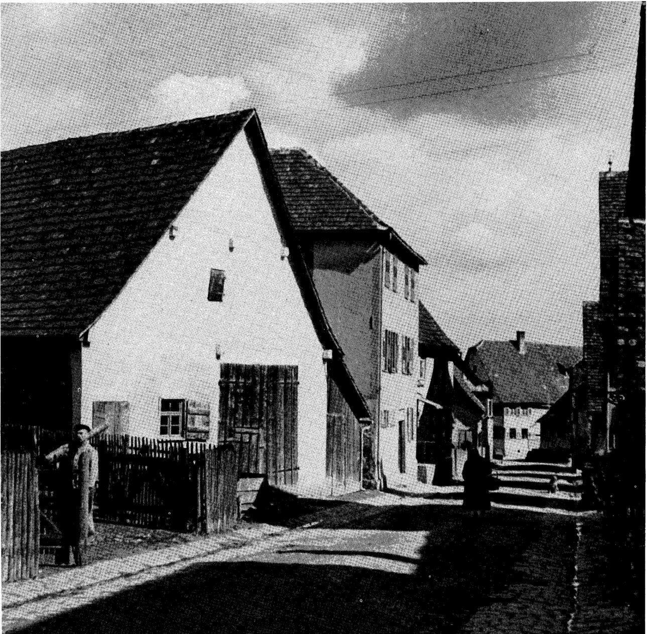
Die Himmerreichgaß ums Jahr 1927