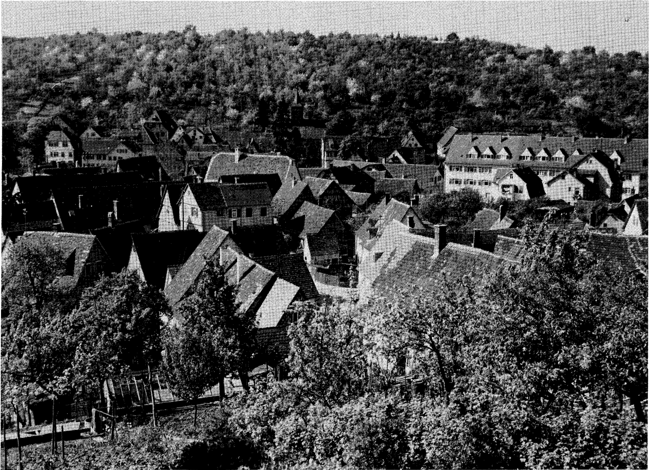
Blick über die Dorfmitte zur damals noch völlig unbebauten Kirchhalde