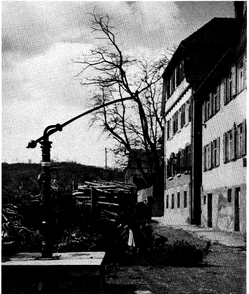
D'Bronngaß – die heutige Kauffmannstraße